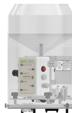
Modelo 200 cm 2