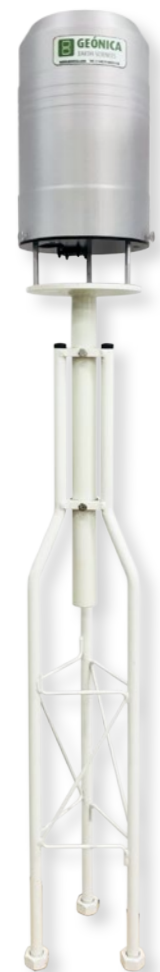
PEDESTAL Modelo SPL-4000

La precipitación acumulada en la cámara interna se controla y vacía después de cada evento de precipitación.